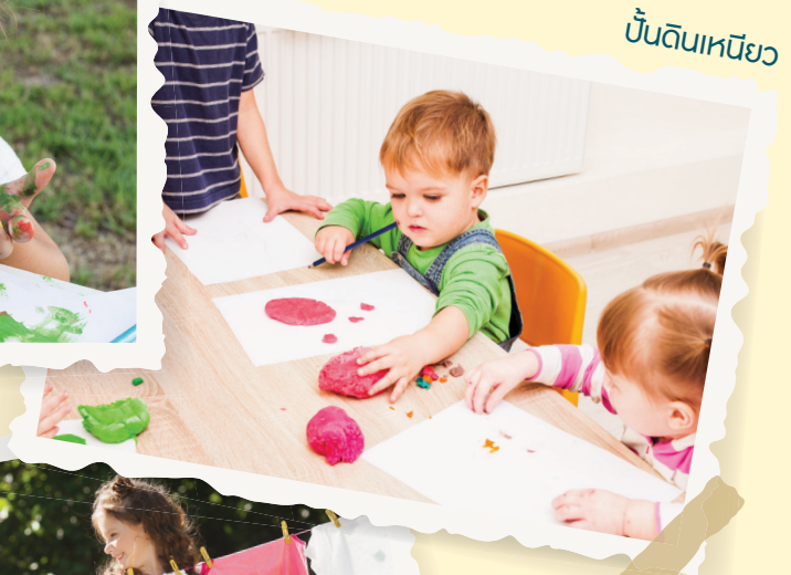
ปั้นดินเหนียว