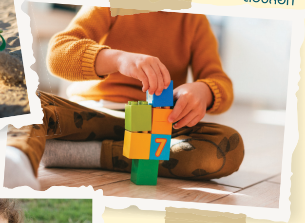
ต่อบล็อก