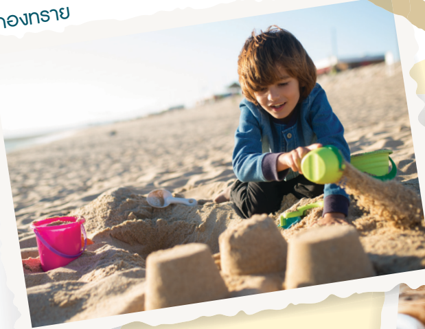
ก่อสร้างทราย